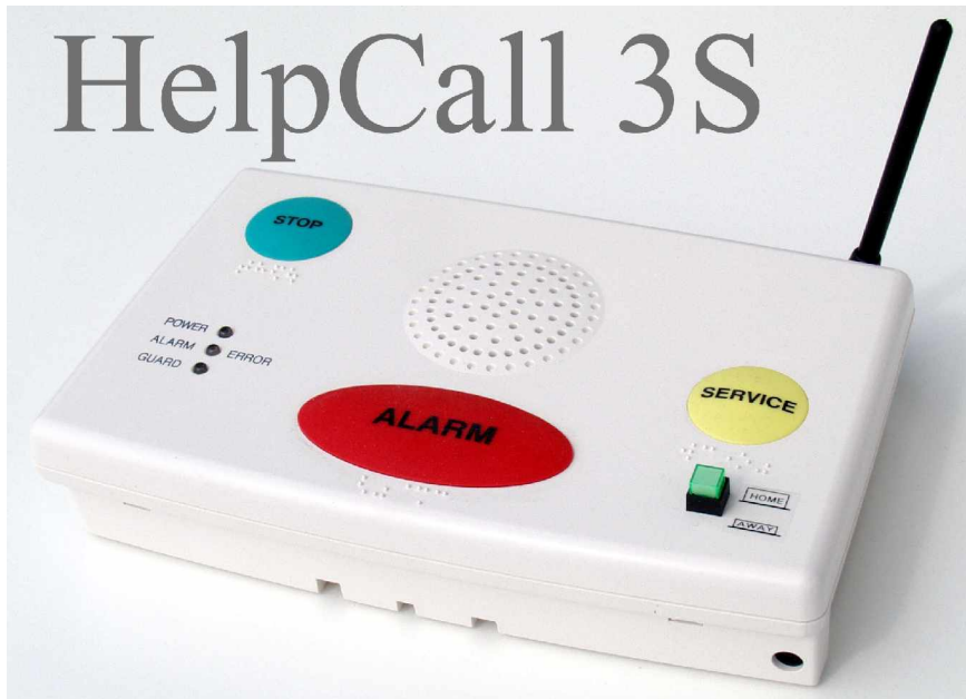
HelpCall 3S mit An- und Anwesenheitstaste.